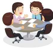
人的安全管理措置