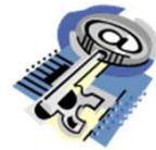
物理的安全管理措置