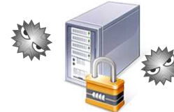
技術的安全管理措置