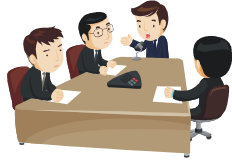
組織的安全管理措置